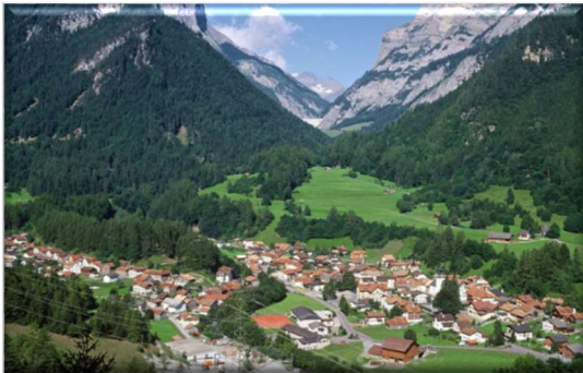
Dorf Vättis SG

Mittagessen im „Restaurant Gigerwald“, Vättis, Kaffeehalt „Sagibeiz Seegüetli, Murg“