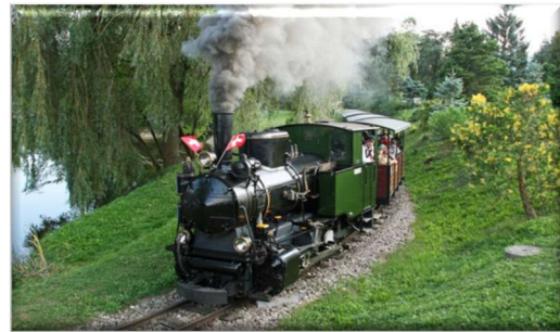
Zug durchs Gartencenter

Gerne erstellen wir Ihnen eine Offerte mit Ihren Angaben zum Zeitplan und möglichen Stopps. Den Preis kalkulieren wir dann für Sie unter Aspekten der Gesellschaftsgrösse, Fahrzeugwahl und Strecke sowie saisonalen Unterschieden.